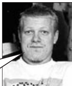
Speilvendt bilde. Fiffig?

"Vi har analysert håndskriften. Det er din kones"