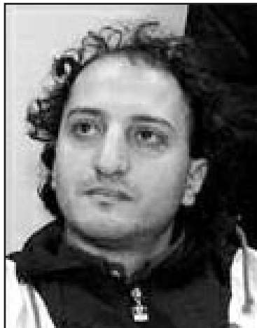
Ikke alle fra Skien er opptatt av fotball

Lørdag åpnes med den flotte Vikingsingelen, både med og uten vokal, opptil flere ganger. Spaserer så beint fram til sentrum, hvor vi med nød og neppe, fresk skreppe, får med